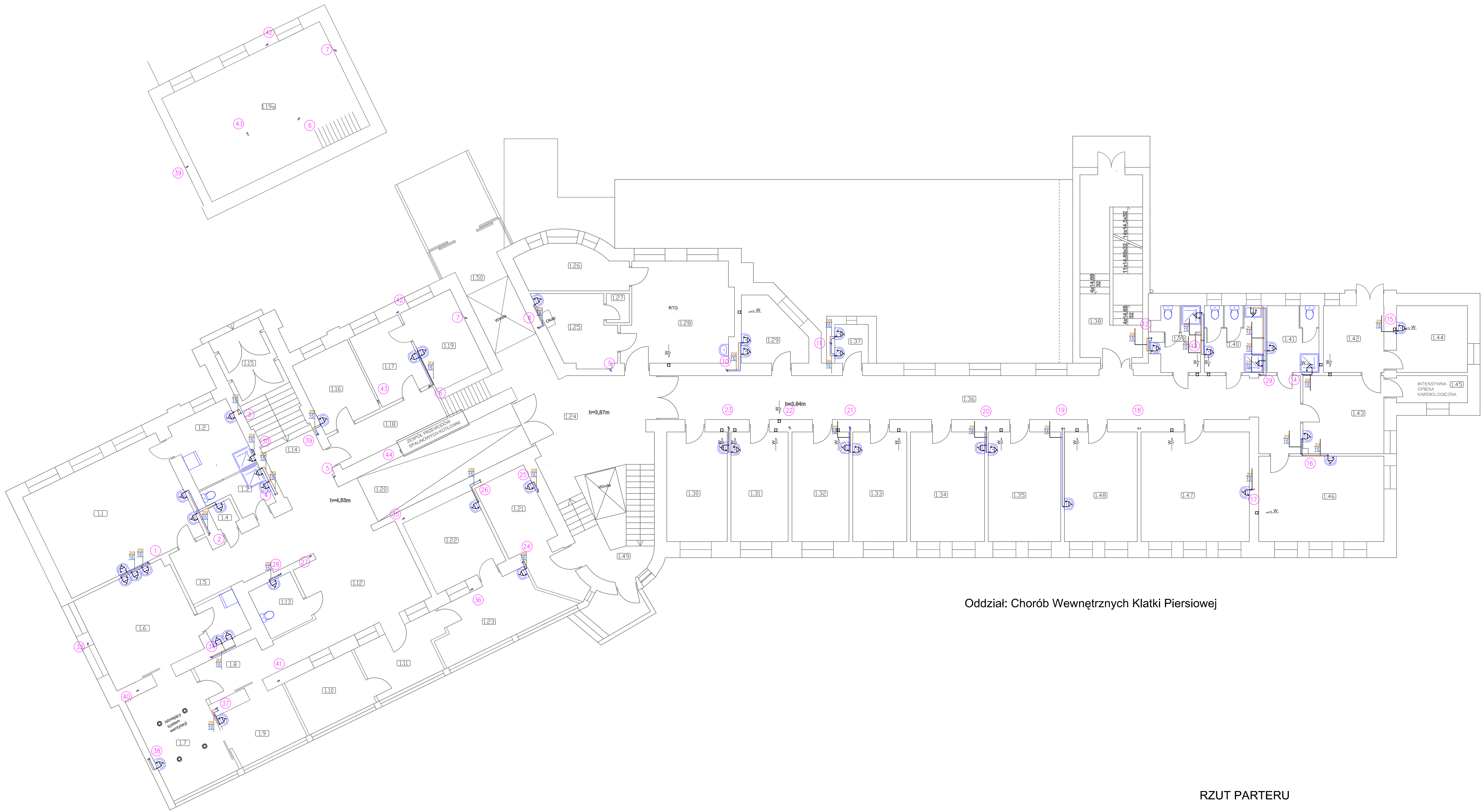
Oddział: Chorób Wewnętrznych Klatki Piersiowej