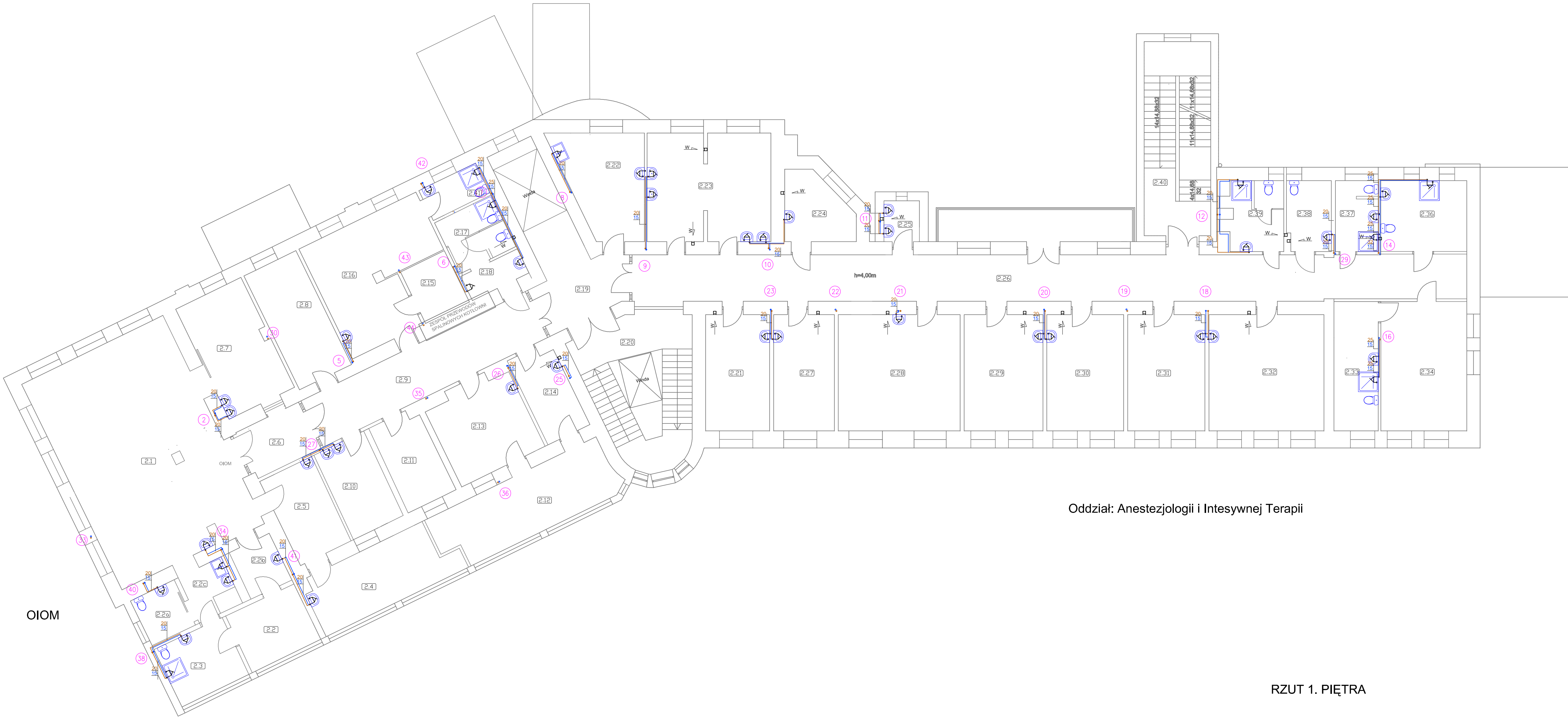
Oddział: Anestezjologii i Intensywnej Terapii